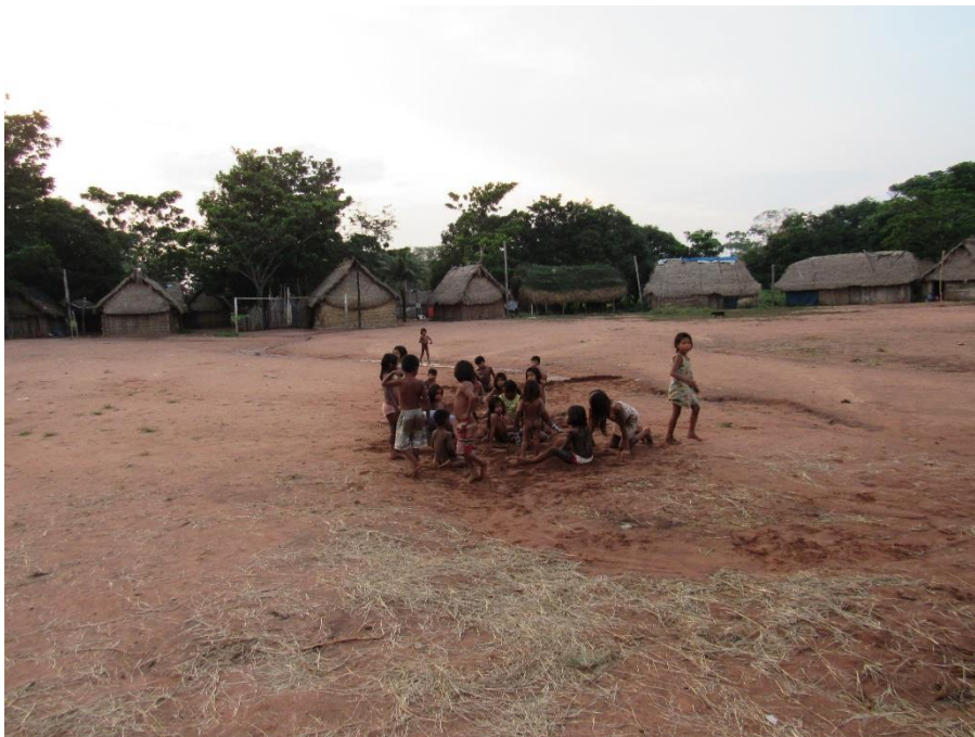
Foto – Aldeia Moxkàràkô no rio Riozinho