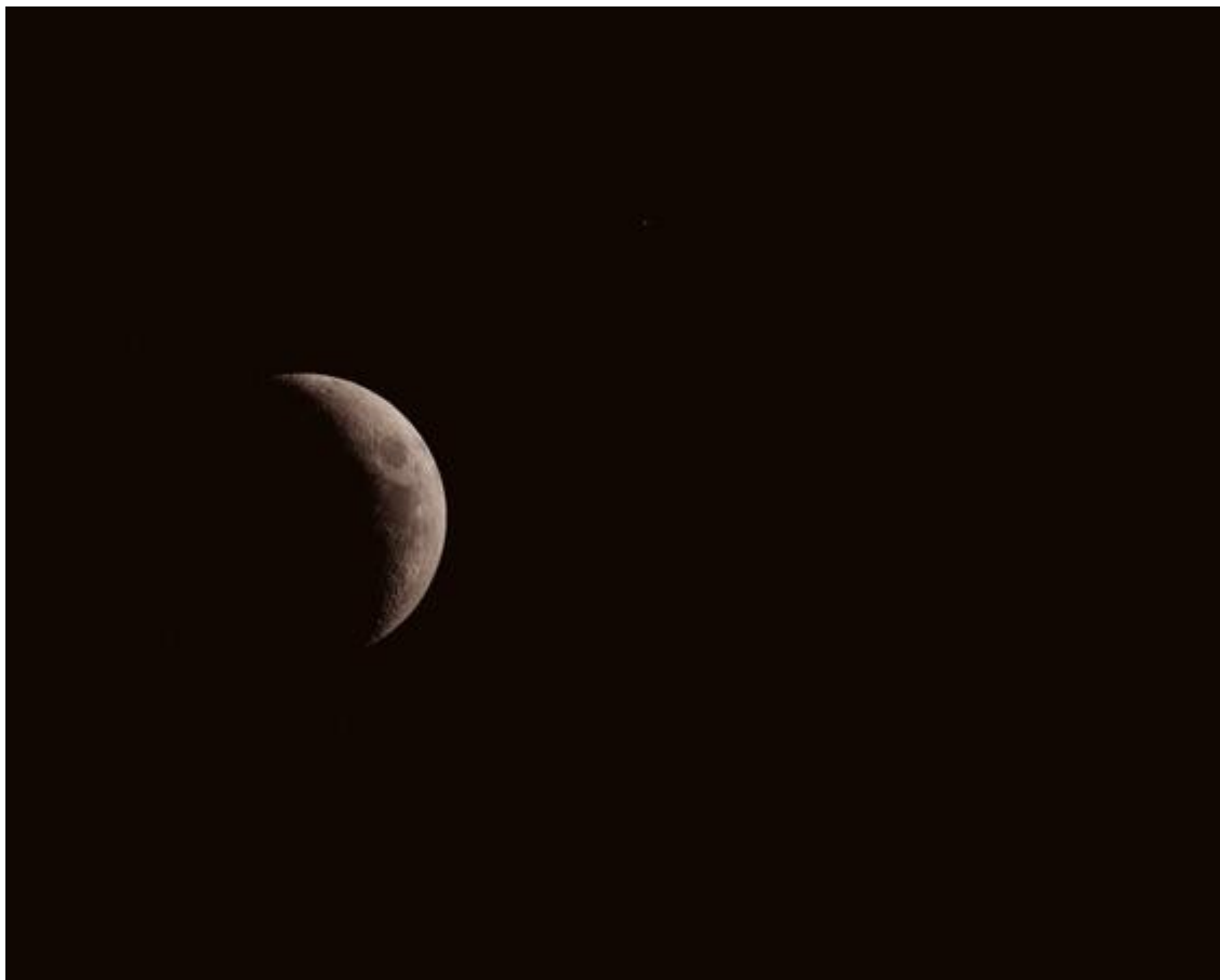
Anexo 1 - Dead Military Satellite (DMSP 5D-F11) Near the Disk of the Moon.