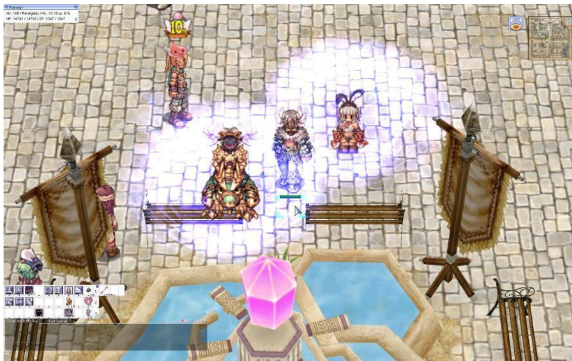
FIGURA 4 - Personagens com diferentes equipamentos de customização

de cada classe. O próprio nome do personagem é aspecto utilizado para interagir, podendo identificar-se através dele em grupos específicos ou propor uma ou múltiplas identidades. Algumas profissões podem utilizar acessórios exclusivos, como o “mercador” e suas evoluções, que utilizam carrinhos que aumentam a capacidade de carga do personagem, além de modificar o visual.