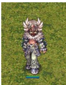
FIGURA 1 - Ransur, personagem da classe renegado escolhido para imersão em BRO

O personagem previamente criado e escolhido foi o avatar com o nome “Ransur”, da classe “Renegado”, em inglês “ Shadow Chaser ” (FIGURA 1), uma das últimas classes lançadas no jogo 11 . “Ransur” é um personagem com nível relativamente alto de experiência para os padrões do jogo, com possibilidade de sobreviver em certas localidades em que monstros são mais poderosos. Isso facilita a pesquisa, pois se a opção fosse um aprendiz , por exemplo, haveria a necessidade de um longo processo de evolução do personagem para que fosse possível frequentar determinados locais ou realizar missões.