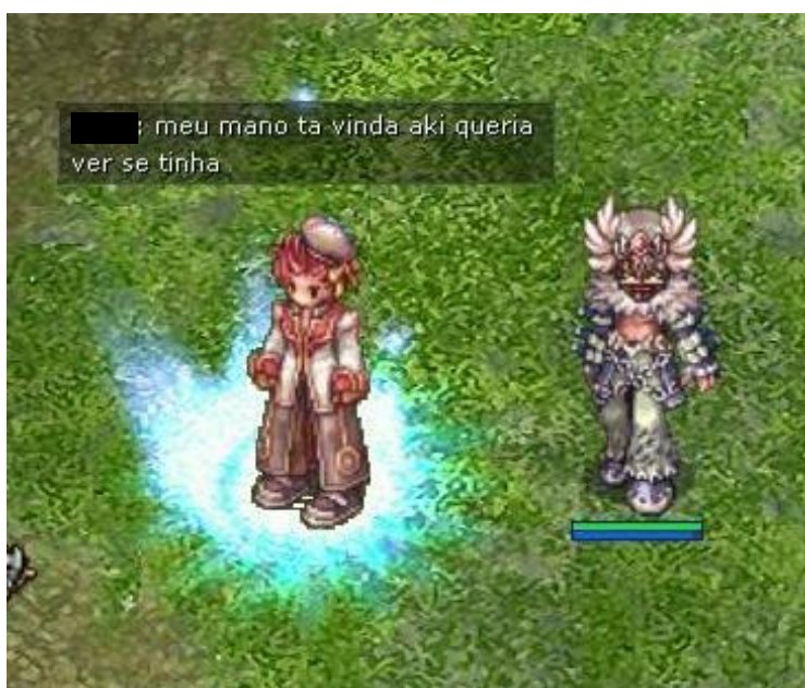
FIGURA 21 - Exemplo de diálogo através do chat geral

É importante ressaltar que Brasil Ragnarök Online apresenta inúmeras possibilidades aos usuários e que estes se apropriam das ferramentas e desenvolvem suas próprias formas de se comunicar. A ferramenta mais simples de interação é o chat textual. Quando um jogador seleciona a opção “todos” na janela inferior à esquerda e digita um texto, uma pequena caixa de texto surge acima do personagem com o texto digitado, e os jogadores próximos podem ler o que foi escrito (FIGURA 2). Ao selecionar as opções “grupo”, apenas quem está no grupo poderá visualizar a mensagem e assim funciona para os diálogos com jogadores de uma mesma guild . 12