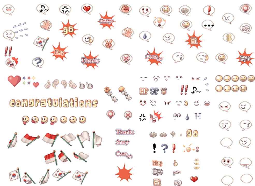
FIGURA 3 - Emoticons de RO