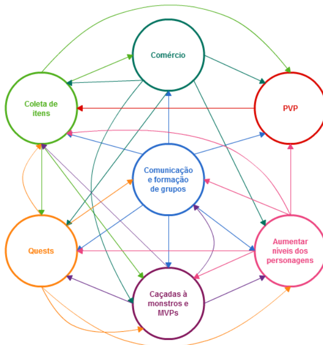
FIGURA 5 - Esquema da inter-relação complexa entre as principais atividades em BRO

O que chama atenção em relação às atividades principais dos jogadores é que se mostram diretamente interligadas umas às outras. Na tentativa de elucidar essa relação, criou-se um gráfico para demonstração dessa demanda (FIGURA 5).