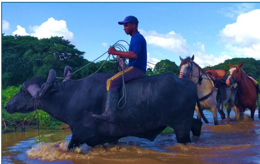
Figura 11 — Vaqueiro conduzindo animais de montaria