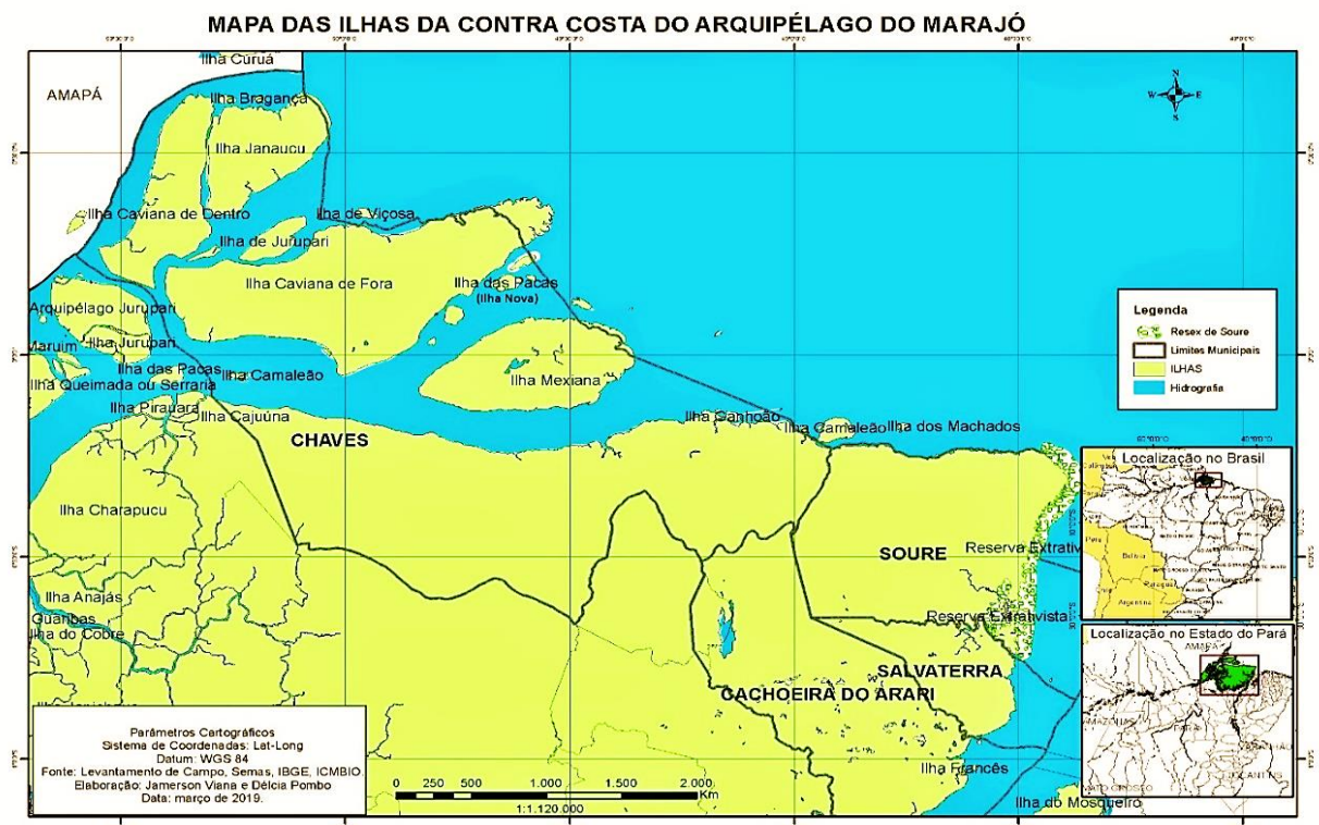
Figura 8 – Mapa das Ilhas entre Chaves e Soure