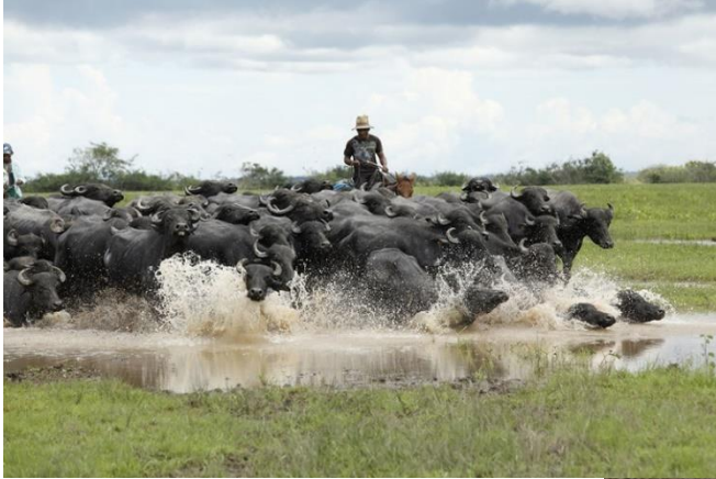
Figura 4 – Campos do Marajó no inverno