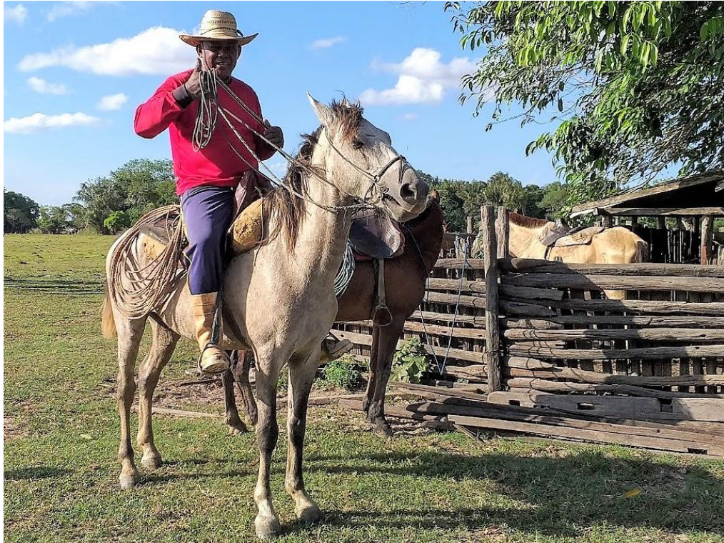
Figura 9 -- Vaqueiro: profissão reconhecida por lei

Fonte: Arquivo da autora – dezembro/2019