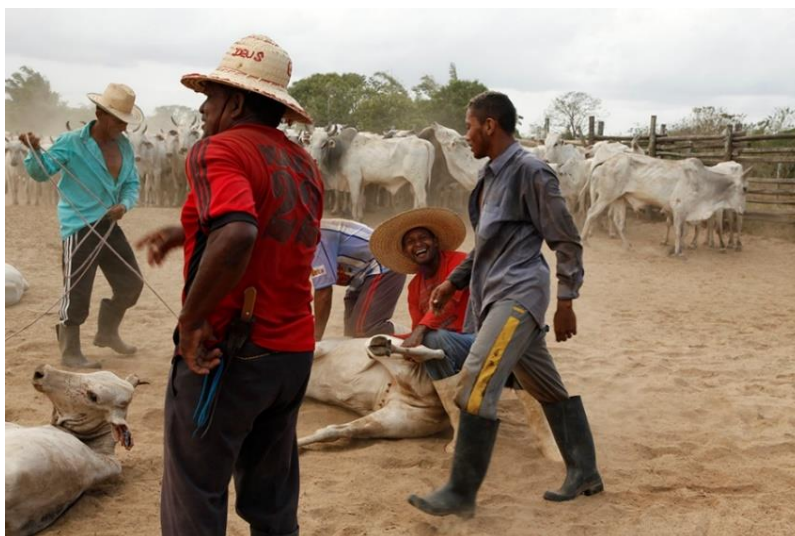
Figura 12 – Serviço realizado em campo