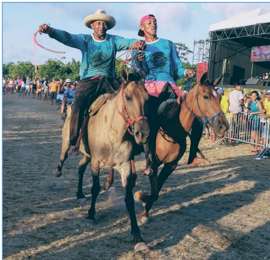
Figura 14 Cruzando a linha de chegada