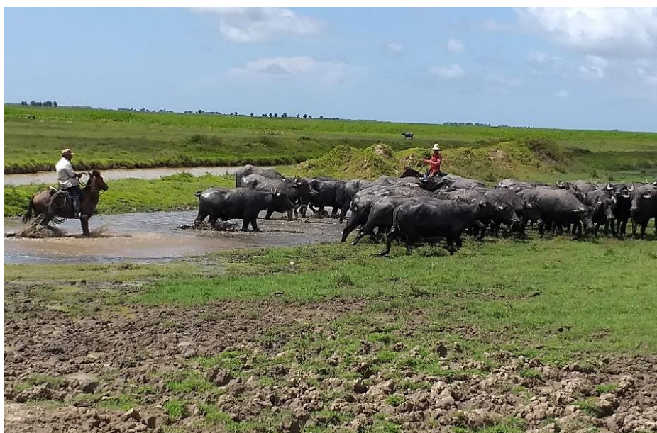
Figura 3- Vaqueiro conduzindo gado para o curral

E ao modo do ritual de saída dos vaqueiros, tangendo o gado, a escuta de vozes, como em Jurandir, em meio ao arranjo da partida: “– Ei! Ei! Ei! Vêra! Ei! Boiama!”.