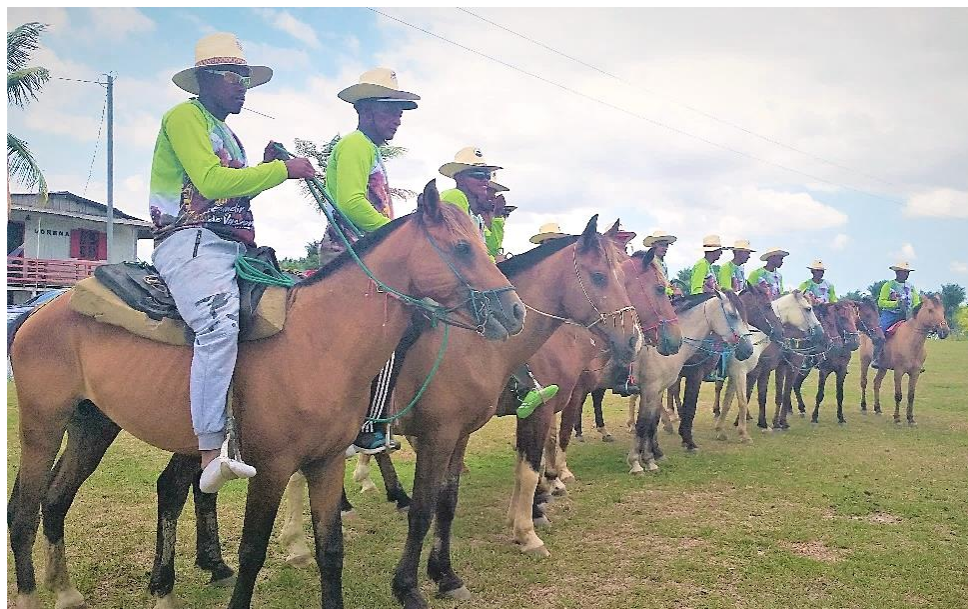
Figura 2- Vaqueiros a postos aguardando o sinal de largada da corrida

Fonte: Arquivo da autora – dezembro/2019