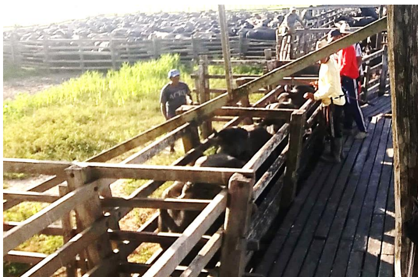
Figura 13 – Serviço realizado no curral e na manga

Mas... na sequência narrativa, o sujeito estabelece a diferença do serviço dos antigos para os contemporâneos sem as descrições de antes, para o modelo de trabalho atual, faz uma síntese “Hoje em dia, não. Tem o curral, né?! e a manga, pra passar tudo na manga. Essa é a diferença”. No curral e na manga não há essa interação e o momento prazeroso do convívio em meio às tarefas no conjunto cede espaço para o trabalho realizado individualmente ou com poucos vaqueiros, em separado.