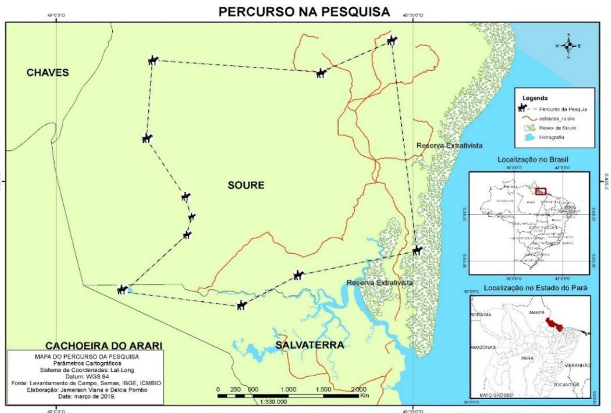
Figura 7 – Percurso da Pesquisa