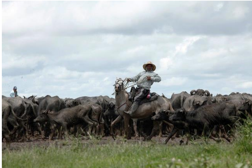
Figura 1 - Vaqueiros tocando a malhada