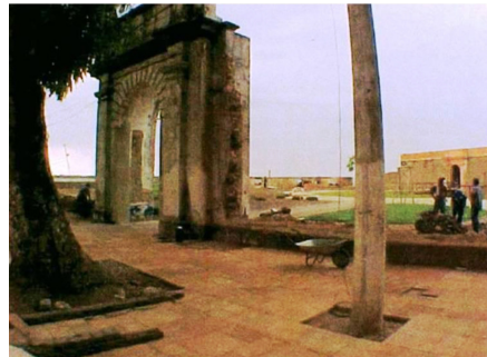
Figura 2. Imagem do pórtico já sem o muro (Adaptado de Costa 2007:97)

De toda forma, há constantes atribuições aos objetos, como argumenta Hilbert (2006). Além disso, os significados vão mudando ao longo da vida dos objetos (Lima 2011), posto que ele perca e incorpore atributos, passa por “redes de significados que o classificam e o reclassificam em categorias consti-