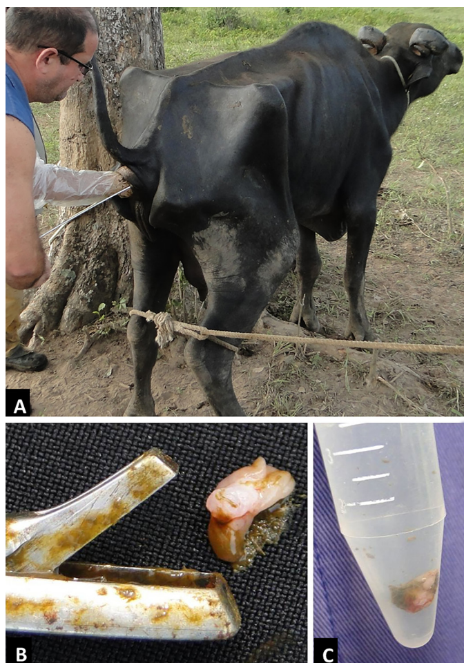
Fig.1. (A) Realização de biópsia retal, com auxílio de uma pinça Mathieu, para o diagnóstico de paratuberculose em búfalo. (B) Fragmento coletado. (C) Fragmento coletado em frasco tipo Falcon, em formol a 10%.

Kit comercial da Qiagen (QIAamp® DNA Mini Kit para tecidos). A reação de qPCR foi realizada usando os Primers e sondas para o gene is900 (F-5'-TGCTGATCGCCTTGCTCA-3' e R-5'-GGGCTGATCGCGATGAT-3'; S-5'-FAM-CCG GGC AGC GGC TGC TTT ATA TTC-3'-BHQ1) (Sigma®); e os Primers e sondas para f57 (F-5'-TTCATC-GATACCCAACTCAGAGA-30 e R-5'-GTTCGCCGCTTGAATGGT-3'; S-5'-Cy5-5'-TGCCAGCCGCCACTCGTG-3'-BHQ2) (Sigma®) (Ireng et al. 2009). Na reação foram utilizados 2µl de solução de DNA, 12,5µl do Mix (RealQ-PCR-RT dUTP-UNG Master Mix kit) (Ampliqon, Dinamarca), Primers na concentração de 0,6 pmol/µl e sondas na concentração de 0,4 pmol/µl, 0,5µl de H 2 O e 2µl de MgCl 2 (50nM) (Invitrogen®), num volume total de reação de 25µl. A reação foi iniciada a 50°C durante 2 minutos, e 95°C, durante 10 minutos, seguido por 45 ciclos de desnaturação a 95°C, durante 15 segundos, anelamento/extensão a 60°C durante 1 minuto. Cada amostra foi testada em triplicata no termociclador LightCycler 480 (Roche, Alemanha) de análise de dados.